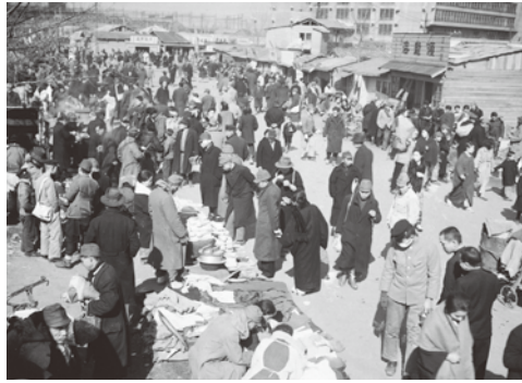
梅田の闇市 (昭和20年頃)