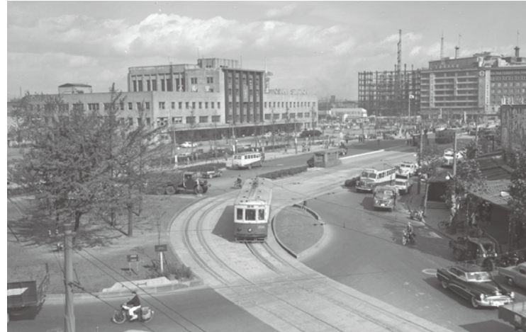
大阪駅前 (昭和30年頃)