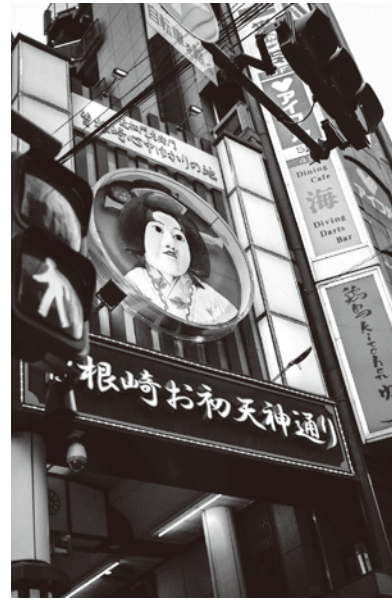
現在のお初天神通り