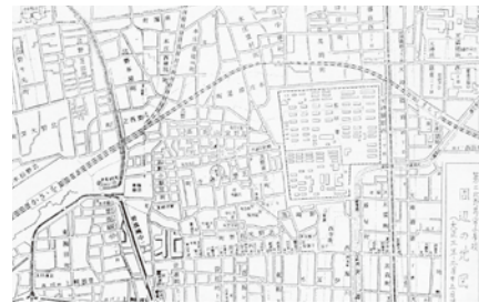
曾根崎周辺の地図 (大正3年)