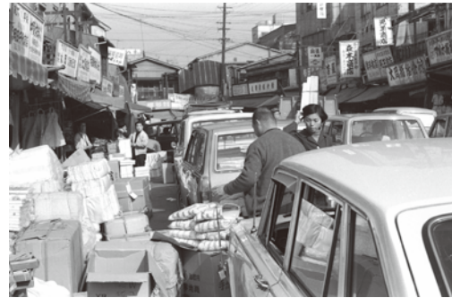
大阪駅前阪神百貨店裏の繊維街 (昭和44年)