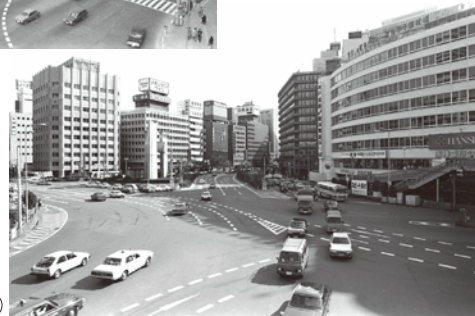
梅田御堂筋の起点 (昭和57年頃) (大阪歴史博物館所蔵)