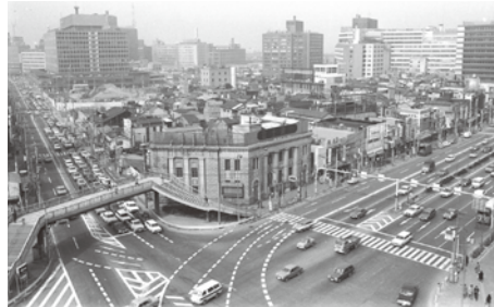
梅新交差点から駅前ビル建設予定地 (昭和48年) (大阪歴史博物館所蔵)