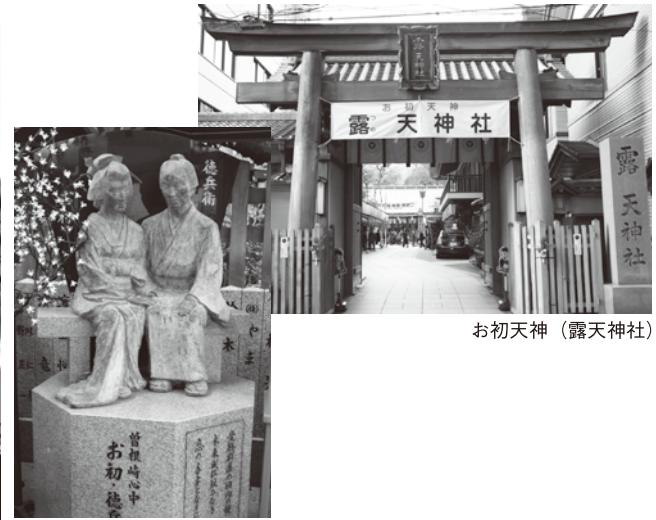
お初天神 (露天神社)