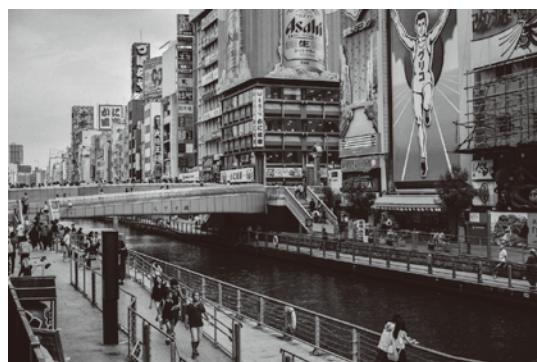
▶とんぼりリバーウォーク開通(平成17年)