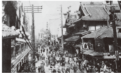
▲昭和 4 年頃の道頓堀中座前