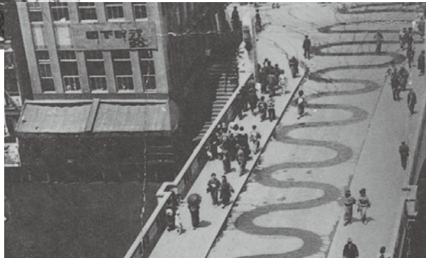
▲大正14年に完成した鉄筋コンクリートの戎橋