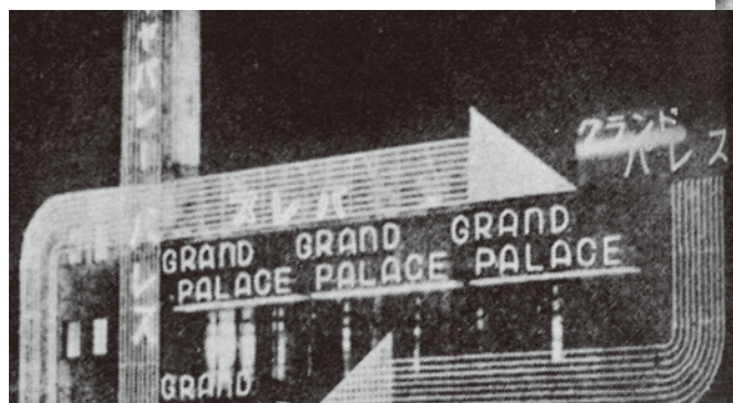
▲キャバレー「グランドパレス」(昭和10年頃)