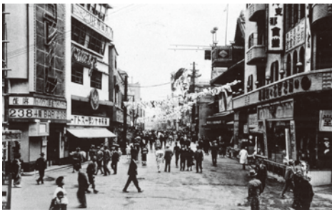
▲昭和初期の道頓堀(戎橋筋との交差から)