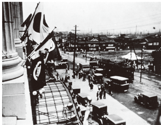
▲高島屋(南海ビル・昭和 7 年建築)前での 御堂筋建設工事