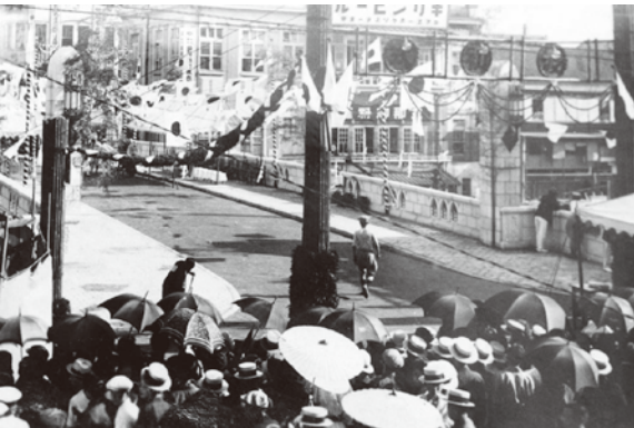
▲完成した戎橋の渡り初め直前の写真