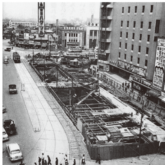
▶昭和32年 初めての地下街が難波にオープンする