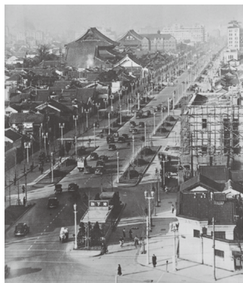
▶昭和12年5月 御堂筋(梅田)難波が完成