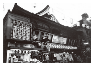
中座さよなら公演 「じゅんさいはん」(平成11年)▲