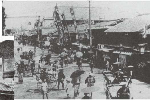
▲明治中期の道頓堀