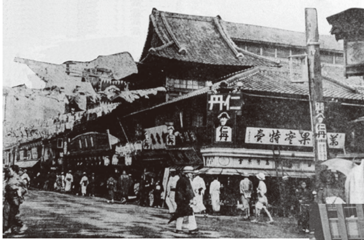
▲大正～昭和初期の道頓堀中座前