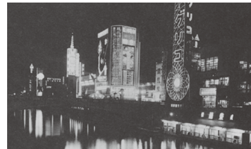
▲「赤い灯、青い灯・・・」の道頓堀川のネオン (昭和 12 年頃)