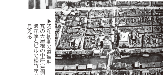
▲昭和初期の道頓堀 瓦の大屋根の中座(左側) 浪花座とビルの松竹座が 見える