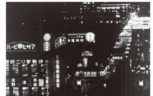
▲昭和初期 道頓堀から戎橋、心斎橋筋方面を見る夜景