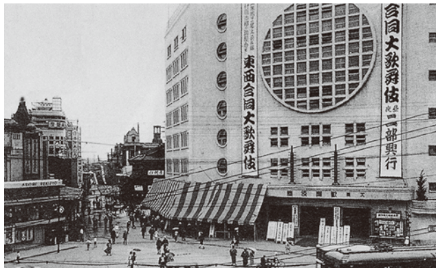
▲観客 3000 人収容の大阪歌舞伎座は昭和 7 年オープン