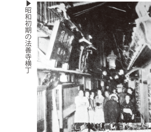
▲昭和初期の法善寺横丁