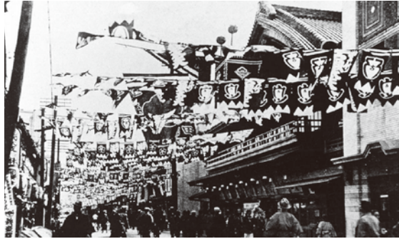
▲昭和初期の浪花座前