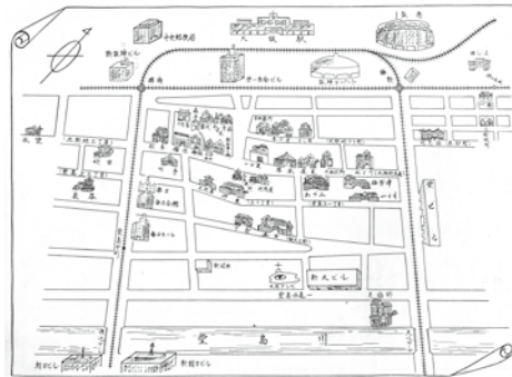
昭和35年頃の北新地組合発行の芸妓扱所地図