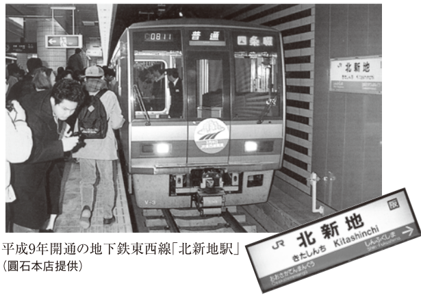
平成9年開通の地下鉄東西線「北新地駅」