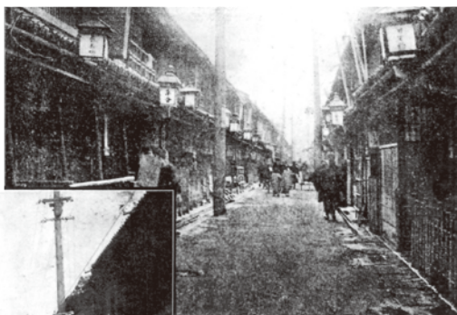
明治時代の曾根崎新地(大火前)