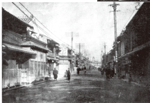
明治42年「北の大火」後の 曾根崎新地(現北新地)