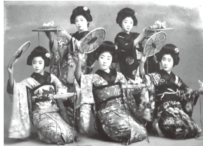
芸妓の舞い（大正-昭和初期）