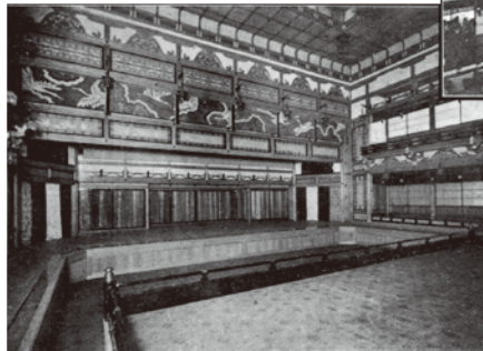
北陽演舞場、大正元年12月25日起工