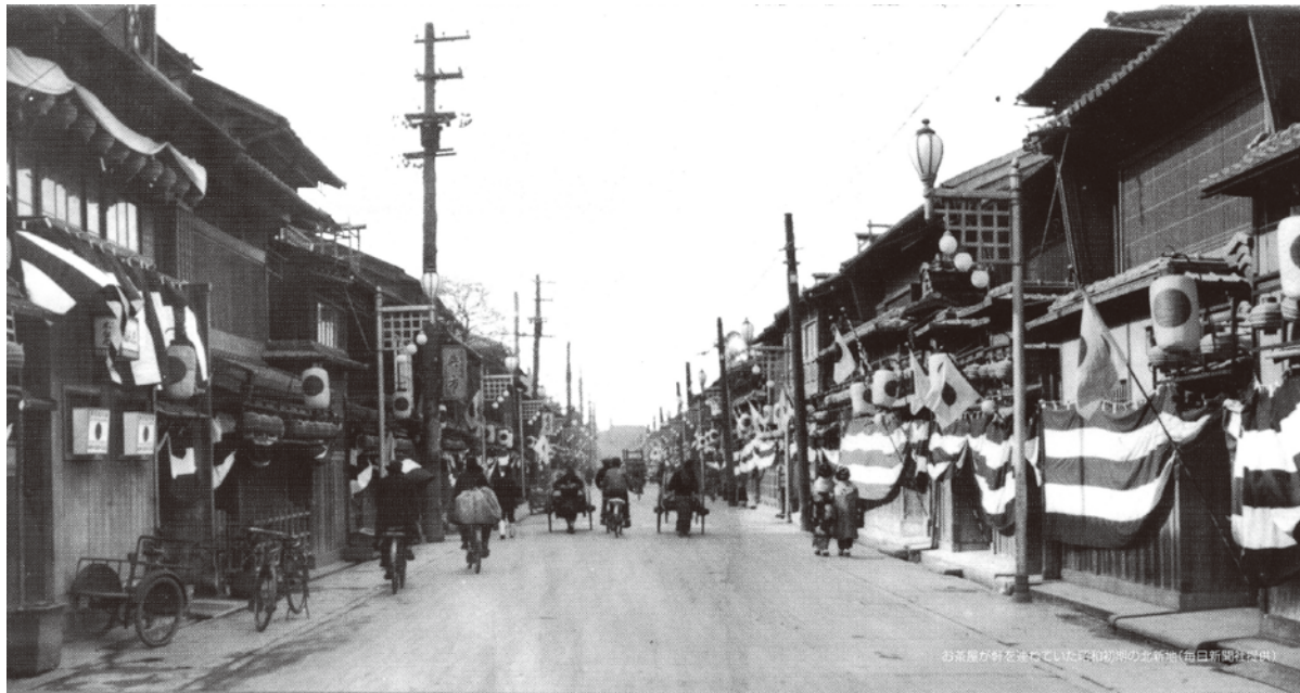
昭和初期の北新地