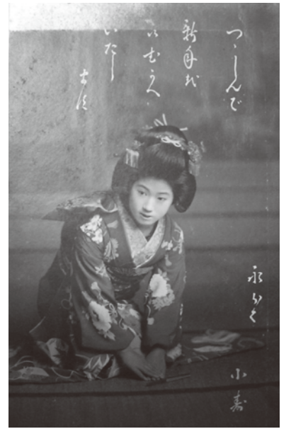
昭和元年頃の芸妓