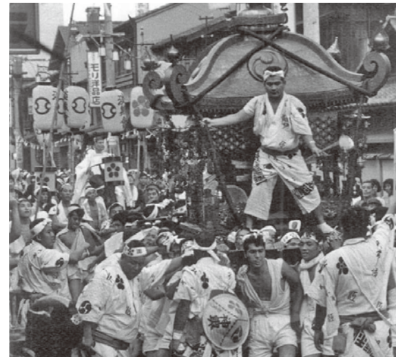
昭和42年 日本三大祭 天神祭 神事 陸渡御 北新地周辺の写真