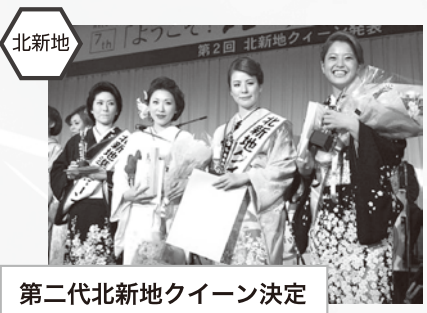
第二代北新地クイーン決定