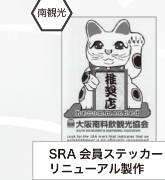
SRA 会員ステッカー リニューアル製作