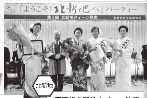
第三代北新地クイーン決定