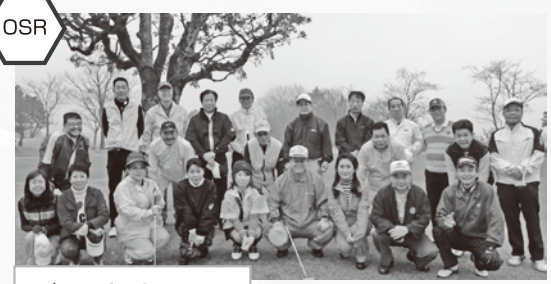
ゴルフ親睦コンペ