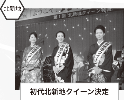
初代北新地クイーン決定