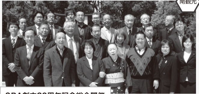
SRA創立20周年記念総会開催