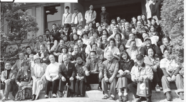
組合ホームページリニューアルを機に 掲載店45店舗から90店舗に拡大