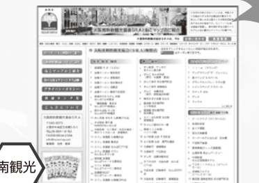
SRAホームページリニューアル (会員店検索サイトオープン)