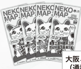
大阪ミナシティマップ (通称: NEKO MAP)