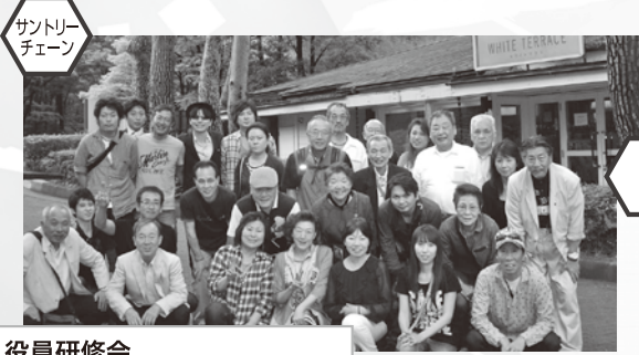
役員研修会 白州蒸留所及び 登美の匠ワイナリー視察研修

組合員店紹介および組合PRサイトとして パソコンサイト・携帯サイト同時開設 (45店舗掲載)