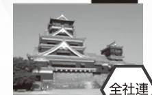
第37回 全国社交飲食業代表者 熊本大会