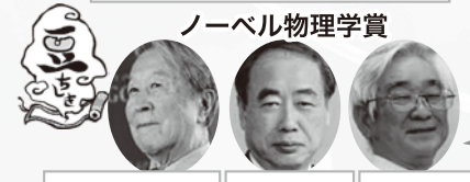
ノーベル物理学賞