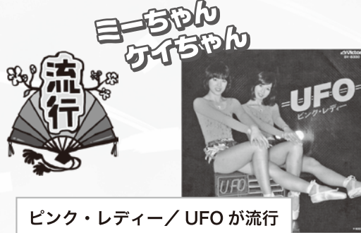
ピンク・レディー/UFO が流行