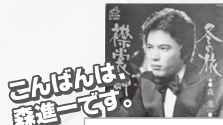
襟裳岬 / 森進一