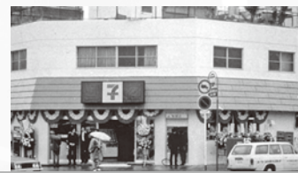
コンビニエンスストア 第1号店「セブン-イレブン」開店