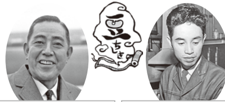
1974年 佐藤栄作氏 ノーベル平和賞 受賞