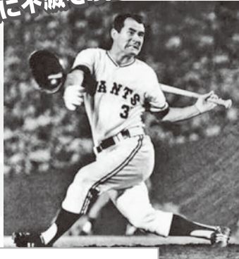
長嶋茂雄 現役引退