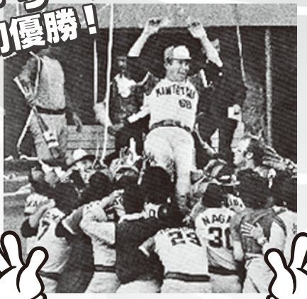
近鉄パファローズ初優勝