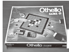
オセロゲーム 流行