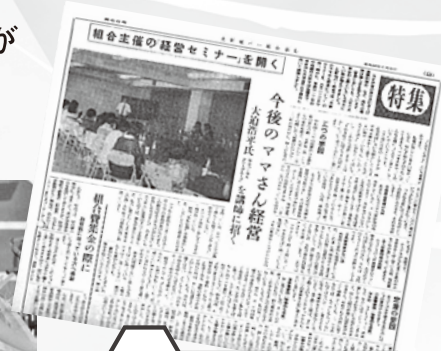
北新地 今後のママさん 経営セミナー開催