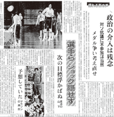
日本 モスクワオリンピック不参加