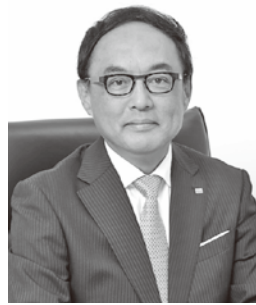
株式会社エクシング