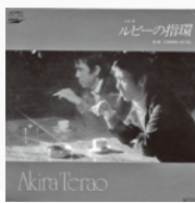
ルビーの指環 / 寺尾 聡