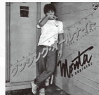
ダンシング・オールナイト /もんだ&ブラザーズ