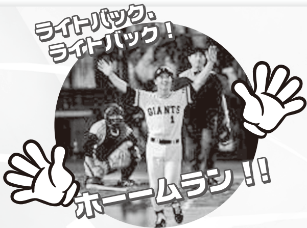
王貞治がホームラン 世界記録 756 号を達成