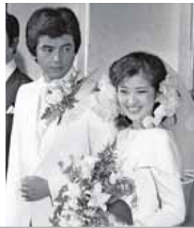
山口百恵と三浦友和が結婚