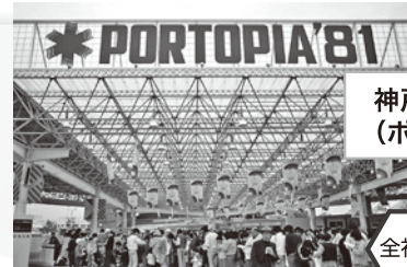
神戸ポートアイランド博覧会 (ポートピア '81) が開幕