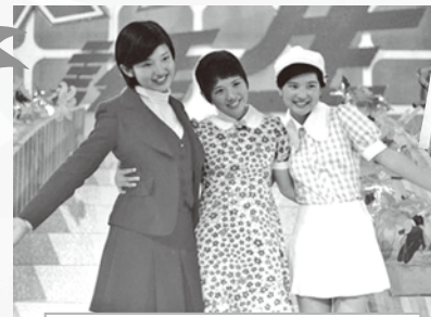
花の中三トリオ (山口百恵・森昌子・桜田淳子)