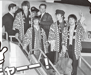
エレキ・ブームの到来