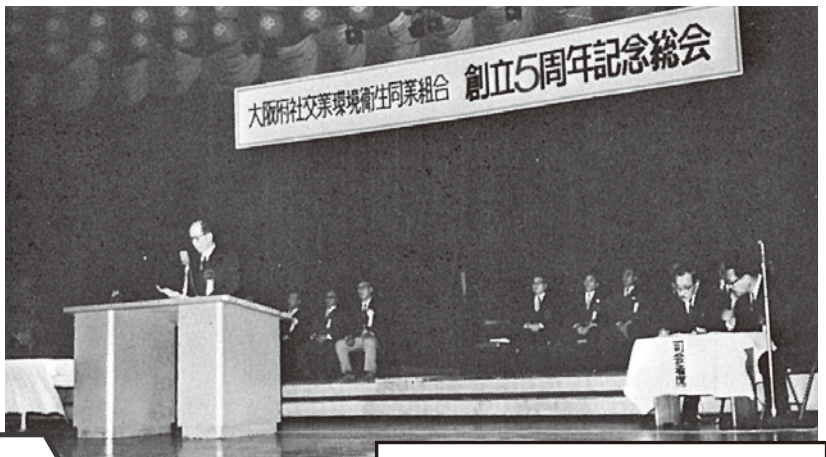
創立5周年記念総会