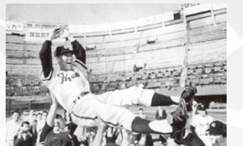
南海ホークス バ・リーグ優勝