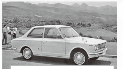
トヨタカローラ 495,000円